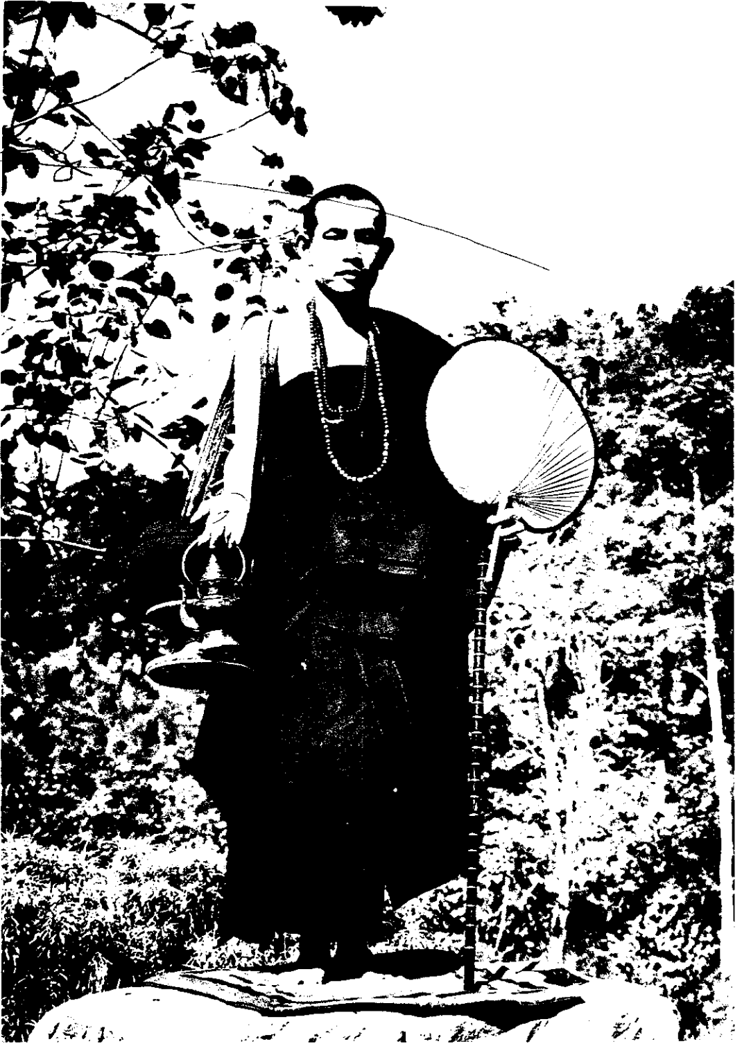
ဗြဟ္မစိလ္လညာဇုမ ညာဏသံဝဂ္ဂော