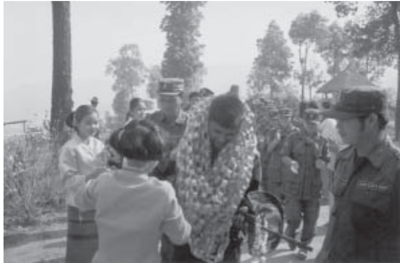
သိုက်မာဆီးပျားခွင်းပံးလူး ကိဂ်, လုဂ်းဂိမ်း ဆလသ ဂိင်းတုင် (SSA-S) ခပ်ပွဲ. ဂွပ်ပွဲဆွဲပေဆိခွင်း သိုက်မာဆိခိဆိ,လတ်

လမ်း မာဂ်,ခွင်း 238 လုဂ်း၊ မိုဝ်း 3 ဗေဂ်း၊ မာဂ်, ပွမ်း 1 လုဂ်း၊ မာဂ်,ထိပ်, 1 လုဂ်း ပံးလူးသိုက် တံးဆွဲ လိုဝ်းသိုက်,ခါဆိ မိဆိ,လတ် (မာဆိပွဲတူဝ် တ/ 264180) ကျား,ယု 29 ယွဆွဲတုးပေ 4 (မုဆိသိုက်,ဝိဆိ,လိင်,ခွမ်း)။ တပွဲခွင် 43 (မိုဝ်းပိင်း) (ကသလ ဝိဆိထုဂ်းခွမ်း)။ ပေး ခမးလိုဝ်း ကူးတိဆိ,မုင်, (မာဆီး) ဆင့်ဗွင်,လေး (ယင်း) ယု,ဝါဆီးမဂ်းလတ်, လေးဝိင်းကျိုင်, ပျေး, တိုင်းကေး,ဂျူး,ဝတီ, မီးပီးဆွဲ 3 ဂေ့ ပိဆိဂေ့,လိုဆိ။ ခပ်းသိုက်,မိုဝ်း ဂွပ်ပီ 2001 ဗေဂ်းဂါဆိသိုက်တံး ယခမးတိဆိ 4 လိုဆိမိုဝ်း။