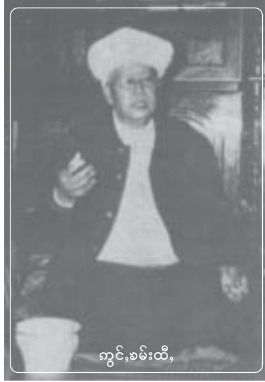
ကွင်၊စမ်းထီ၊

ပူခ်၊ဂူင်၊ဆမ်ပွခ် ဆေးလေးဝ်းဝ်းမုဂ်၊မံ၊ ကူင်၊ဂူပ်ဆမ် မီးဂူင်၊တူခ်းယျး 2 ဂူင်၊ ဂူင်၊ဆိုင်၊မီးလီင်၊လားခိုခ်းတူဂ်းဝ်းမုဂ်၊မံ၊ လပ်းစွင်လူင်၊ ဂျပ်၊ဂိုပ်၊ ကျ၊ယူ 38 ပီ ပီခ်စစ၊ ဂူပ်ဂင် (ကွခ်တင်းယူ၊မိုင်းဆေး) မိုင်းလီင် ယူ၊ပွဂ်းပေးပူခ်၊ (ပေးစာဝ်) ဝ်းတူခ်းတီး။ ဂိုတ်းမားတင်းစတု၊ပီ 2001 မခ်းလံးမီးဂူင် သီစပ်၊ (လက်းတမ်စပ်) ယူ၊တီးဝါခ်းဂူပ်ဆမ် သေ ဂိုတ်းဆေးတိုက်းပူခ်။ ထီင်ဂူင်၊ဆိုင်၊သမ် လပ်းစွင်လူင်၊ ဂျပ်းတျးဂူပ် ပီခ်စစ၊ဂူပ်ဂင် ကျ၊ယူ 47 ပီ စတု၊ဂိုတ်းပီ 2005 (ပီခ်ဂူင် ဂိုတ်းယျးစာဝ်) ဆမ်ယျးမီး တေး၊မားတီး ဝ်းတူခ်းတီး စလ၊ဝ်းလူင်၊။ လွင်၊ဂူင်၊ယျး 2 ဂူင်၊ဆိုင်လူမ်းသိုက်းမားခ်စလ၊လီယူ၊ ဂူလ်းဂျး ကပ်ပိုခ်းယိုတ်းမုခ်စလ၊ ဂူ၊ယူ၊ဂေးဂိုတ်းဂိုင်၊ ကမ်၊ဂူခ်ဆဲးယဝ်။