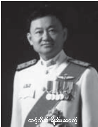
ထံးသိခိုင်း ခိုခိုင်းဆဝတ်

မိုင်းဖွင်းသုခိုင်းတုမ်ဂုလုခိုင်း ဂှာသိုင်ဂုခိုင်း မိုင်း ဆးလုဂ်တုဂ်း (2001) ဆဆဲ ပု၊တီ၊