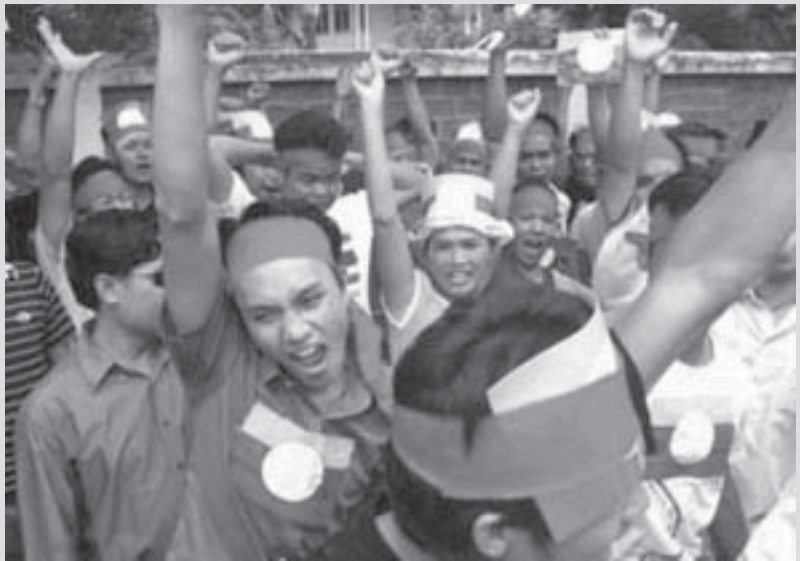
ပီးဆွင်တံးလိုင်မားမီးမိုင်းထံး ခမ်ဂာင်လှ်တု၊ ယွမ်းမာမ်၊ ရှ်းပမ်ဂွမ်းခေးမိုင်းတံး ခလး ဂမ္မံထိမ်လူင်ပွင်လိုင်တံးပိုဆဲဗေင်၊ ဂွမ်းခေး (ဆေးလုမ်းဗွင်းတင်မာမ်၊ တီးမိုင်းရှ်း၊ မိုင်းထံး)

တင်းခတ၊ ဂာင်ပီ 2005 မား သိုက်မာမ် တိုက်ခမ်၊ ရှူဆဲမိုင်းဗုးမိုင်းတံးပွတ်းဂာင်/လား ပိုဆဲဗေင်၊ သာဆဲခတ်းလုမ်း လူင်ပွင်လိုင်တံး လုပ်းယမ်း။ ဝံးဆဆဲကမ်၊ ရှိုင် မာမ်သုင်၊ ရှိုင် သိုက်ဆပ်ရှပ်ရှပ် ခပ်တပ်ဆဲပိုဆဲတီးတပ်လုမ်း 758 ကမ်ဂမ္မံထိမ်လူင်ပွင်လိုင်ရှပ်းရှ်း။