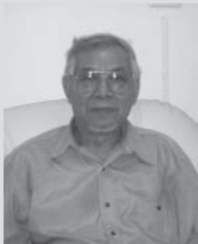
ဗွင်းလိုင်ဗုးဆဲမိုင်း လပ်းခိုဆဲရှ်း

18.9.04 ပင်ဂုမ်လူင်ရှူဆဲမိုင်း ပွတ်း ဆမ်လိုင်မီးဗုးဆဲမိုင်း 200 ကပ်၊ ဂမ် တု၊ ဂေး၊ တင်းလူင်ပွင်လိုင်။ ကာဆဲကပ် လပ်း သိုက်ရှူမိုင်းပွဆဲ ပီဆဲလွမ်လိုင်သေတု၊ ရှပ် ကမ်၊ ရှပ်ခလး၊ ခိုဆဲလိုင်၊ လပ်းသိုက်ခမ်၊ ဗုး- ပီဆဲလွမ်လိုင်။