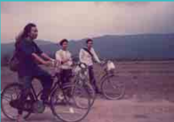
ဂုဆိးဆုမ်၊ လုဂ်းလုမိး SNLD စိးတုင် လှိုင်းယွမ်းယာပ်၊ ယွမ်းမှိုဝ်း ကိပ်၊ ရှာသုဆိးတုမ် တျးဂမ့်ထိမ်ပုတီ၊ ရှမ်းသိုဝ်း လုမိးဝါဆိးဆွဂ်း ယာဆိးဂိဝ်း 10 လမ်း မှိုဝ်း 1990 ဆေးလှိုင်းတင်