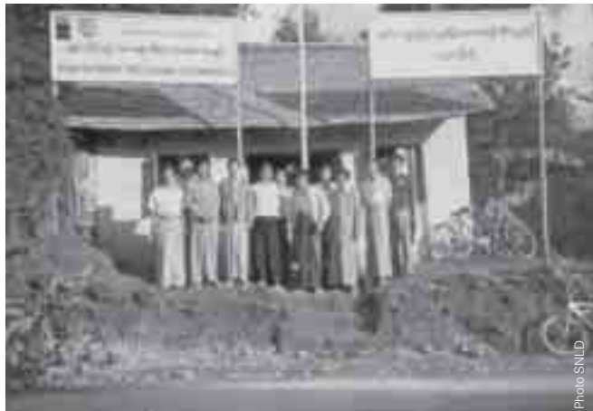
ကိုင်ဆိုင်လင်းပုတ်းဂေးရှုတ်းရှုပ်ကမ်းတုတ်းစွဲးစိုင်း ယွန်းလင်းဆေးတီးမာဆင်းလွတ်၊ ဂိုတ်းစလး ရှုမ်းဆမ်းလုတ်းလုမ်း SNLD စပ်ရှုမ်းရှိုင်းဂါဆင်ဂေးသင်းလုမ်းစွဲး တီးကွင်းလိမ်ပင်၊ ဝါဆင်းသုမ်းတံး (ပွတ် 3) စိုင်းဂိုင်းတုင် လင်းလုံးပိုတ်၊ လုမ်းစွဲး။ (ဝံးပင်လိုက်းတင်းဂါဆင်ပုတ်၊ ဆွဲးယုင်း NLD)

ဆွဲ 23 ဂေးဆံး လု 7 ဂေး၊ တိုက်ပိမ်း MP 7 ဂေး (တုတ်းစွဲး 1 ထုတ်၊ တိုင်းလုံးကွတ်၊ 3 ဂိုတ်း 3)၊ လုံးထုတ်၊ တံးသုမ်း 9 ဂေး။