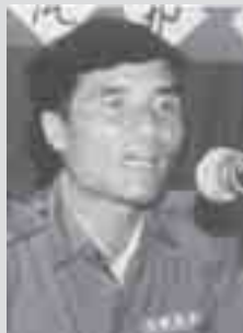
သီဝ်မိခ်၊လျိုင်