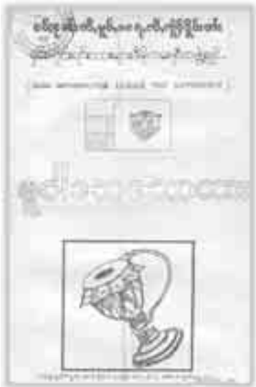
ဥပဒေ-လက်မှတ်ရေးထိုးခြင်းကား SNLD

လုပ်သမားလုပ်ငန်း SNLD ဂုဏ်ထူးဆောင်များ ကဆံ ပျံ့တီ၊ပံးမိုင်းလောင်းစိုင်း 11 လမ်း ရှမ်းဂဆံ ဂေးတင်းမားလမ်းကုန်းလီလောင်းစိုင်းဖွဲ့စည်း UNA (တင် 31.7.2002) ဆန့်ကျင် လုံးဝ မဆင်းလင်း၊ ပီဆံတင်းမုဆင်းလွှမ်းစိုင်း ဂေးရှင်းမဆင်း။ တီးရှိုင်းမဆင်းလင်း တူးရှင်းဆံ ရံပီဆံတီးရှိုင်းပင် တီးရှိုင်းပွဲးစိုင်းထူး ဝဆင်းယှပ်၊ဝဆင်းလှုပ်၊ တီးရှပ် ထိုင် UN, EU လိုင်းဆံ ဂေးရှင်းမဆင်း။ ဂေးရှမ်း သားလိုင်းတီး SSIAC ကဆံ SNLD တင်း