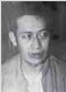
ဂူလု်သီဝ်၊ဂင်း