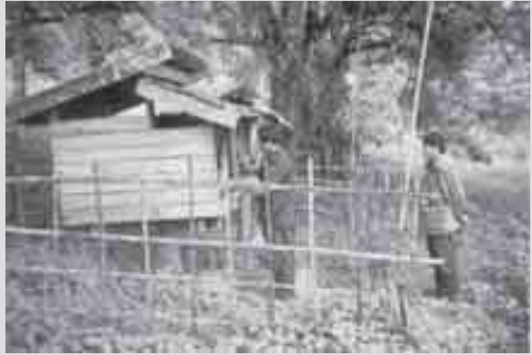
၁၉၉၇ နှစ်လယ်ပိုင်းလောက်က ရှမ်းပြည်အလယ်ပိုင်းတနေရာတွင် ဗိုလ်မှူးကြီးရှက်ဆစ်နှင့် ဒုဗမက-မိန်းစင့် အတူလှုပ်ရှားခဲ့စဉ်က

၎င်းအပေါ် ပြည်သူများသည် ဘိန်းကျွန်ဘဝမှ လွတ်မြောက်လိုကြသော်လည်း နအဖ၏လုပ်ဆောင်မှုများသည် ပြည်သူကို မူးယစ်ရာဇာလက်ထဲသို့ ဝကွက်ထိုးအပ်လိုက်သလိုဖြစ်စေခဲ့သည်ဟု သျှမ်းဒီမိုကရက်တစ် ဥက္ကဋ္ဌ စစ်ဆိုင်စစ် ကသုံးသပ်သည်။ □