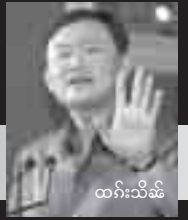
ထက်းသိမ်

ဝံးသေဝင်းလံးဂါးခိုင်းမိုင်းထံး သု့ယုင်; ဂူဆဲခါးသိုက်, ဂဆဲမူး ခါးတင်းလံး လိုဆဲါ ရိုက်ရှဲးဂူဆဲးမိုင်း, ဂူဆဲးရှိုက်ဂါးခိုင်း/ ဂါးသိုက် တိုက်, ဂဆဲပိဆဲ လံးဖွါ, လံးလုမ်း၊ ဂွမ်းဂမ်းဖွင်းရှပ်လီုဂါးခိုင်း/ မါင်လိုက်ဂါးခိုင်း, ဂုဏ်စိ ဆင်တိုက်ခိုင်းမိုင်းဖွင်းခမ်းဝါးဆဲး မိုင်းခွင်လူင်ပွင်လိုင်း; ဂါးခိုင်းဂူဆဲး လူ့ထံး; “ထက်းသိမ် ချိမ်းဆတ်း”။