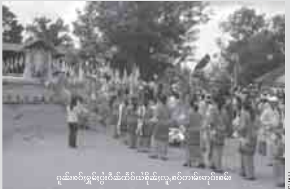
ဂွမ်းခမ်းဂွမ်းပွဲ, သီင်ဝ်ယံခိုင်းလု, ဗဂ်တမ်းကမ်းခမ်း