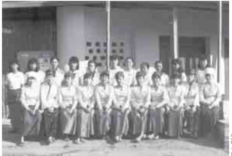
ဆင်းယိုင်းတီးလိုင်းပီဆံလုဂ်၊လုမ်းစပ်၊ SNLD မိုင်းပင်ပိုတီး၊လုမ်းစံ၊

ပျံ့တီ၊ရှပ်သိုင်းလေး SNLD စုဆံထူးဆန်းဆံ အေးထီဂ်၊လီဂ်၊စေးစေးတီ၊ယာဆံကဆံ ကဆံ၊လုံးလေး ဆင်၊ရှိုင်းတေးလင်း SNLD လုလီဝဆံဆံ လုမ်းသိုင်းမဆင်း လင်းတိုင်းဖူးဆန်းလိုင်းတီးပီဆံသို့ မိုင်း 8-9/2/05 (တီးတူးဆံတီး လေး တူးရှင်း) 20-30 ဂေး၊ ပံးကဆံ၊ ပေး-လင်းဆေးတီးမဆင်းစပ်သိုင်း ရှပ်ရှပ်သေ ရှပ်ယိုတီးပီတီး ပဆံ (သုင်း၊ရှိုင်း၊ရှပ်သိုင်း၊ စွင်ဖိုဆံလီဂ်၊လုံး) OCS မိုင်း ရှပ်မဆင်း ဂိုင်း၊စေးတူးရှင်း ကဆံလုဂ်၊မေးစုဆံထူးဆန်း ပီဆံလင်းစွင်၊ ပီဆံလုံးပေး လီဝတီး မေးစပ်၊ သုဆံ၊ တူးဆေးရှိုင်းဖူးရှပ် SNLD ။