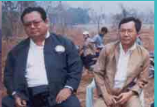
စုဆိးထုဆိးကူးစလးလံးဆုတ်း မှိုဝ်းပင်လုဂ်းသိုဝ်းလုင် ဓာဆိးယွတ်း တီးဝင်းဝင်းစားသိမ်၊ လေးဝ်းသီ၊ ပေး 20/3/2004