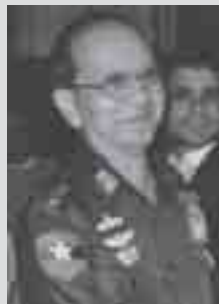
တိုင်းသိုင်၊

တူဝ်တိခ်လုမ်းသိုက်မာမ်း၊ လုမ်းသိုက် တိုင်းသိုင်၊လာတ်းဝါး-သိုက်မာမ်းဂေးစွံးပိုက်၊ ပခမ်ခိုဆဲးယူ၊ ဂူလုင်းဂျ၊တပုံသိုက်ဝါး (UWSA) တက်လံးယွမ်းဂွပ်ပခမ်သိုက်မာမ်းပူဂါင်းတင်း 3 ဂွံးဂာမ် ဆဲးဆေးလိခ်ပာင်သင်း မိုင်းဆင်၊ လုမ်းမိုင်းလုး-