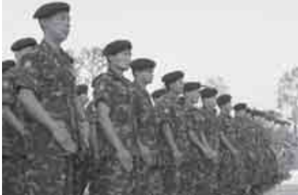
SSA-S တပ်သားများ

လွှဲတိုင်းလျှောက်တွင် ကျောင်းဆရာမ လုပ်ခဲ့ဖူးသည့်အမည်မဖော်လို သူတစ်ဦးကလည်း - “လွှဲတိုင်းလျှောက်မှာဖွင့်ထားတဲ့ အမျိုးသား ကျောင်းမှာ အသက် ၂၀ ဝန်းကျင်ကျောင်းသားတချို့ စစ်သားလုပ်ချင် လို့လူကြီးတွေဆီ စာတင်တောင်းဆိုတာကို လူကြီးတွေက ခွင့်မပြုခဲ့ ပါဘူး။ ပညာကိုသာ ဆက်လက်သင်ယူကြပါလို့ ကျောင်းမှာ လာပြော တာကိုကြုံတွေ့ခဲ့ဖူးပါတယ်” ဟု ဆိုသည်။