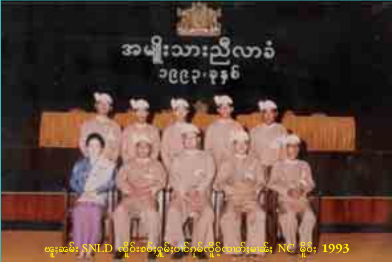
ဗဟိုအဖွဲ့ SNLD လှိုင်းစစ်၊ ရှမ်းပင်ဂုမ်လှိုင်လက်၊ မာခိး NC မှိုဝ်း 1993