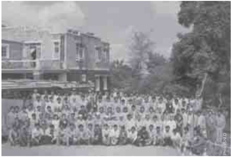
ပၢင်ဂုမ်လုင်ငဝ်းငုမ်းတံးမူဝ်းစုတ်းသီဇးလိုင်စိုတ်းတံး SNLD တီ၊ တူခ်းတီ

“ဝိတ်းရှပ်းဂျေယဝ် ဝိတ်းဂဝ်ဂျေယု၊ ဝိတ်းရှပ်းရှင်ရှပ်းဂျေ၊ ဂျေ၊ ဝိုခ်းတိုင်း၊ ပေဂျေဝိတ်းဗုတ်းဗုတ်း၊ ဆမ်လံတ်းဗုတ်း၊ ရှပ်းရှိတ်းဆုးဂိုက်ပိုခ်းဗုတ်းဆဲးဂုတ်း။ ပေးတူဝ်းပိုခ်းသၢဝ်းပီယွမ်းသွင်၊ ထတ်းထွင်စိုခ်းလိုင် တူက်းထိုင်ဝခ်းဂျေ၊ တင်း လုမ်းငဝ်းငုမ်းရှင်သိုဝ်းစွပ်းစုပ်း 18 ဝီတီမ်မိုဝ်း 21/10/2006 လီဇၢမ်း။”