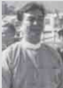
လံးလုမ်း