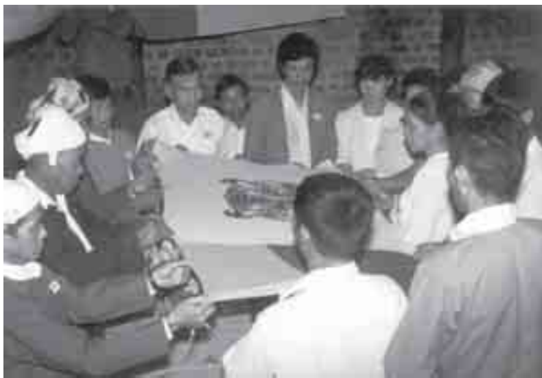
လုဂ်၊လုမ်းစပ်၊မတီ၊သုဆံတုမ်လေး စိုင်းဂိုင်းတုင်း တိုဂ်ကဆံဂပ်၊ ဂိုဆံ၊စေးဖွင်လှုပ် တီးလုမ်း ပိုတီး၊စံ၊ ဆေးလုဂ်၊တင်း 1990

မုဂ်၊လုမ်းစပ်၊မတီ၊သုဆံတုမ်လေး စိုင်းဂိုင်းတုင်း တီး SSSC [စွင် လုမ်း တီးဂိုတီးသိုင်းပွဲး ရှပ်၊ SSA-N+SSNA] ရှပ် ကဆံဂေးတင်းမားလီဝမိုင်း 1996 ဆန့်ကျင် စုဆံထူး ဆန်းဆံသမိုင်းရှပ်ပင် ပွဲးဂေးရှင်းမဆင်း။ မိုင်း SNLD, SSPC တင်းဖူး ဆန်းသီဆန်းရှပ် မိုင်း၊လိုင်းတီး NGSS စပ် 20-30 ဂေး၊ ရှပ် တီး ပင်ဂုမ်တီးစပ်၊ ပွဲးသီဝီမိုင်းရှပ် 2004 သေလုံးလှုပ်စွတ်၊ ဖွင်၊ရှပ်ရှပ်ရှပ် ပံးမေး လိုင်းတီး SSICC ဆန့်ကျင် ဖူး ရှပ်ရှပ်ပျံ့တီ၊ ရှပ် သိုင်း စပ်၊ပေးတုင်း တုင်း၊လုမ်း ဂေးရှင်း မဆင်း။ ပင်ဂုမ် NC မဆန်းဂေး၊ SNLD ပိုဆံဖေး၊တူး တေး ကဆံ၊သိုင်း၊စိုင်း လုမ်း၊ သမိုင်းထူး သား အေးမုဂ်၊စေး တူးရှင်းမဆင်း။ လိုင်း ဆံဆံ လီယှပ်၊ယေး ကဆံစပ်လင်း၊မိုင်း မုတုးဆင်း လီဆန်း ယူးဆန်းရှပ်၊မိုင်း လီဝသေလီး၊ရှပ် ရှပ်၊ရှပ်ရှပ် ဆန့် ယူး။