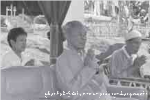
မွမ်, လမ်းဗိသိုတ်, ခလး ပေးထမ်းသုဆင်, တျ, ခမးကံး