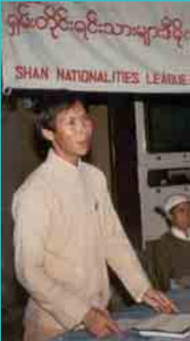
လံးဗဟို၊ ပုင်ရွာမိးမှိုဝ်းပိုတ်၊ လုမိးမှိုဝ်း၊ ဝါဆိးသုဆိးတါဆိး/စိးတုင်