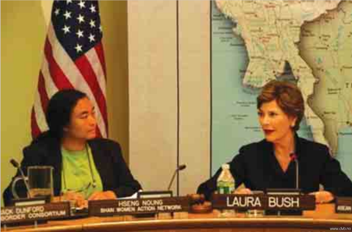
ဆင်းသီင်ဆွင့် ဗဟိုတီဆိးဆင်းယိင်းတီး (SWAN) ကျပ်,ကူင်းလွင်းပဆ်ရှုမိုင်းမာဆိး လွမ်းဂဆိတင်း ဆင်းလေးပိုင်း ဗုတ်သျှိ (Laura Bush) မေးဆင်းလွမ်လိုင်းကမေးပိုဆိင်း ညွတ်ချ် ဗုတ်သျှိ (George W. Bush) တီးပိင်းဆိင်းယွဂ်. မိုင်းဝဆိးထိ 19/9/2006