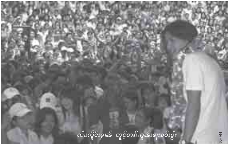
လံးလိုင်းဂုၤဆိ တူဝ်တၢ်.ဂုၤဆိမးစဝ်းပွဲး

ဆိးပၢင်းပွဲးဆံ့ လဝ်းဆးတီးရှုင်ဂုၤဆိဖူး, လတ်းဂုၤဂၢၤဆိစလးပံးယူၤ,လီဂေၤ ဂုၤ,တၢ်းသုမံ ပွဲ.ပဆိတၢ်းရှုၤ,တီးရှီဆိဂၢၤဆိခမ်းမိုင်းလၢဝ်းတံး ဂိုဝ်,ဂဝ်းဖူး,ရှီဆိဂၢၤဆိစလးပံးယူၤ,လီဆၢင်းဂဝ်,။ လိုဝ်သေဆဆိမီးပုးစဝ်းဖေတ်းတံး ဂးစဆိထုဂ်, စံၤဝၢ်ဆိ, 10 ဝၢ်တံး,။