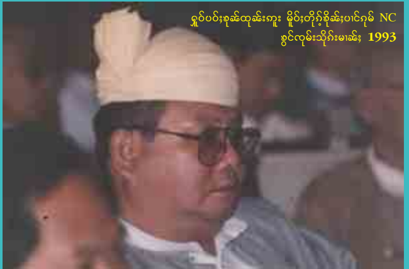
ရှမ်းပင်ဂုမ်စုဆိးထုဆိးကူး မှိုဝ်းတိုဂ်းစိးစိးပင်ဂုမ် NC ဗွင်လုမိးသိုဝ်းမာခိး 1993