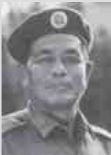
ပူဝ်၊လံးစမ်း