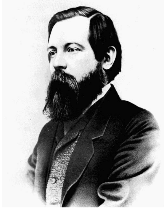
ဖရက်ဒရစ် အိန်ဂယ်